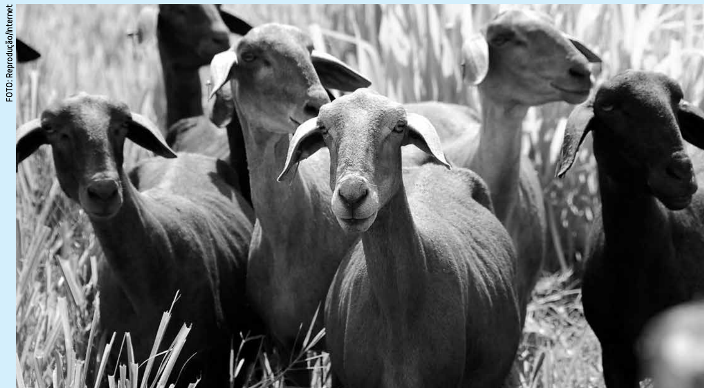
Investimentos na caprinocultura será um dos assuntos da pauta dos gestores municipais durante debate do Pacto Novo Cariri

Ao contrário do que aconteceu 2ª feira, o Banco Central optou por não fazer intervenções extras no mercado