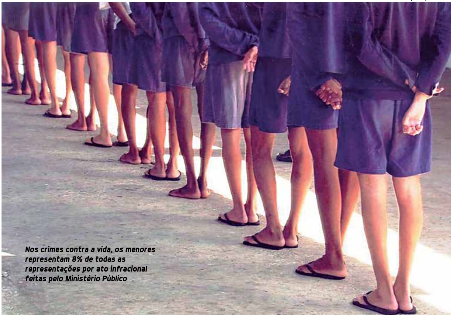
Nos crimes contra a vida, os menores representam 8% de todas as representações por ato infracional feitas pelo Ministério Público

Caso todas as pessoas no País tivessem, pelo me-