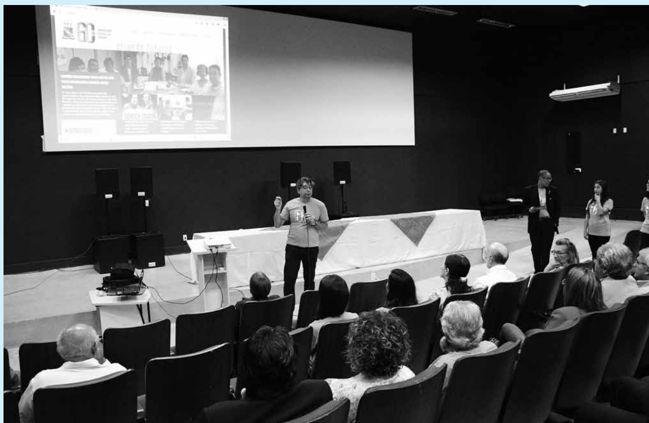
De hoje até dezembro uma série de eventos, a exemplo da página oficial dos 60 anos, (foto), já lançada, vão acontecer

Em agosto foi realizado um recital. O grande evento do mês de setembro é o lançamento dos 70 títulos de livros da Editora Universitária. Em outubro haverá o Encontro Unificado de Pesquisa e