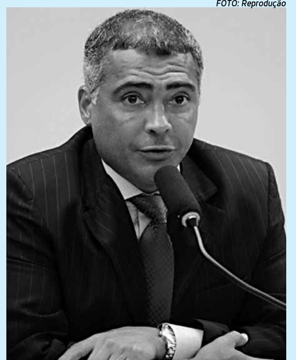
O senador Romário não perdoo o técnico Dunga

"Quando Zico se tornou candidato, eu disse que era uma opção positiva, mas acho que não está preparado. Não corrupto, com certeza. Votaria nele. Mas não terá nenhuma chance. A CBF não o apoia" disse.