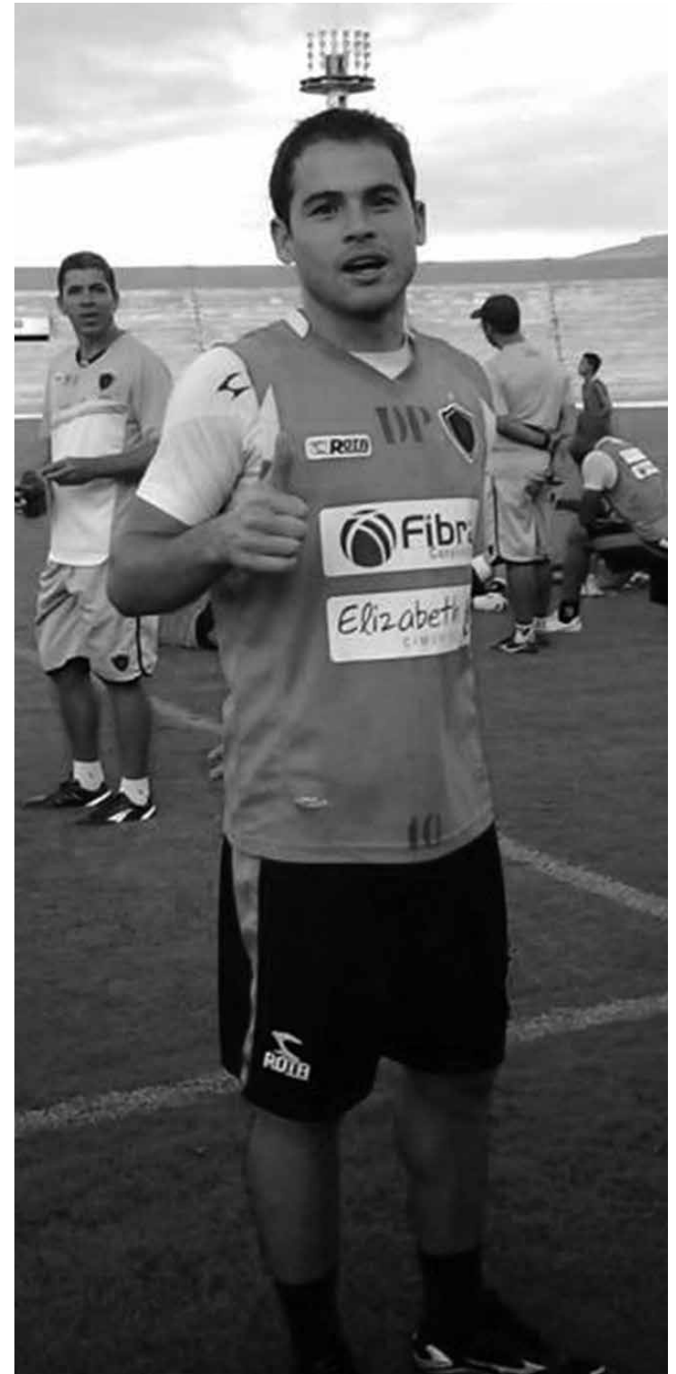
Doda estava desde 2013 no Botafogo e agora muda de clube