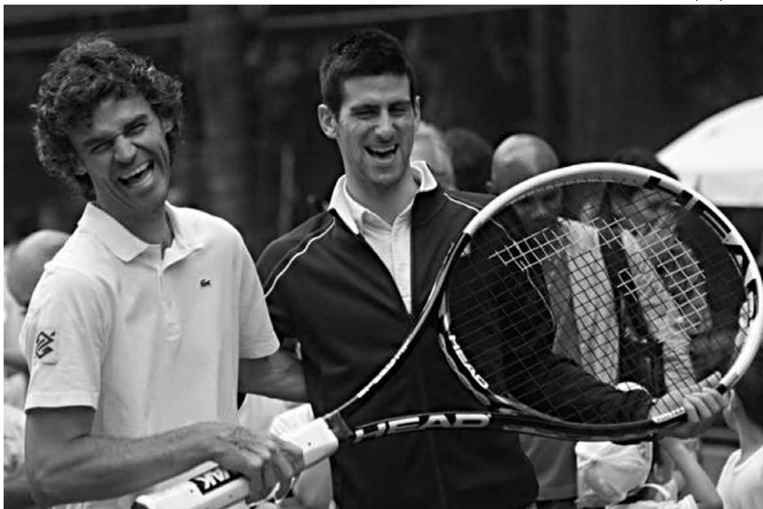
Guga, ao lado do número 1 do mundo, Novak Djokovic, está pessimista em relação aos resultados da Olimpíada de 2016 no Brasil