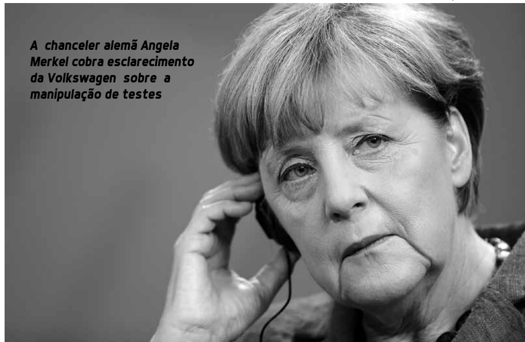
A chanceler alemã Angela Merkel cobra esclarecimento da Volkswagen sobre a manipulação de testes