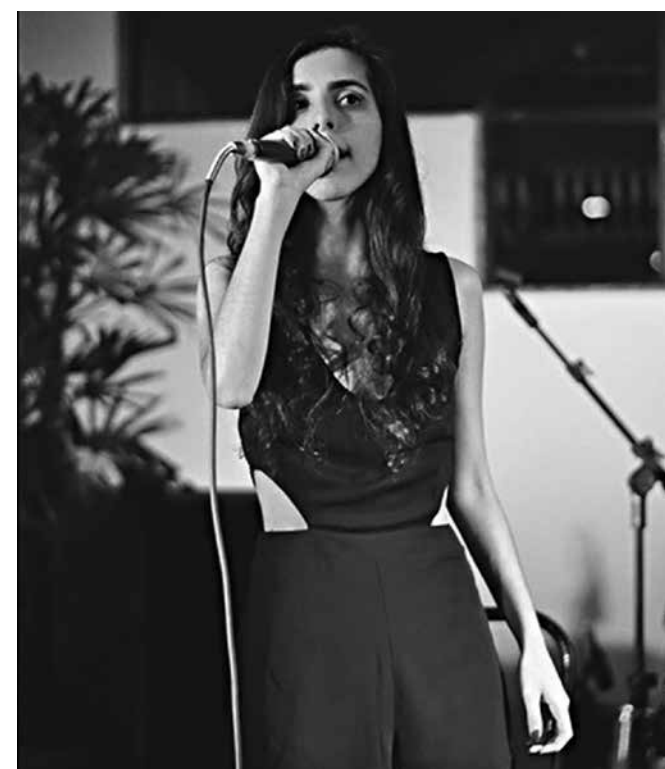
A intérprete é uma nova promessa da música

A apresentação tem início às 20h, na Sala Paulo Pontes, no Teatro Municipal Severino Cabral, com ingressos ao preço antecipado de dez reais, e no dia R$ 10 (meia entrada) e R$ 20 (inteira) a venda na administração do teatro.