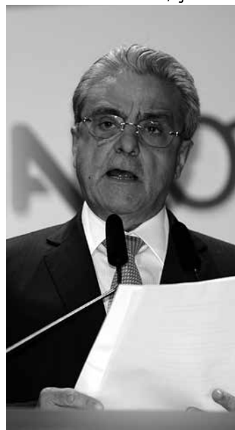
Andrade propõe alternativas