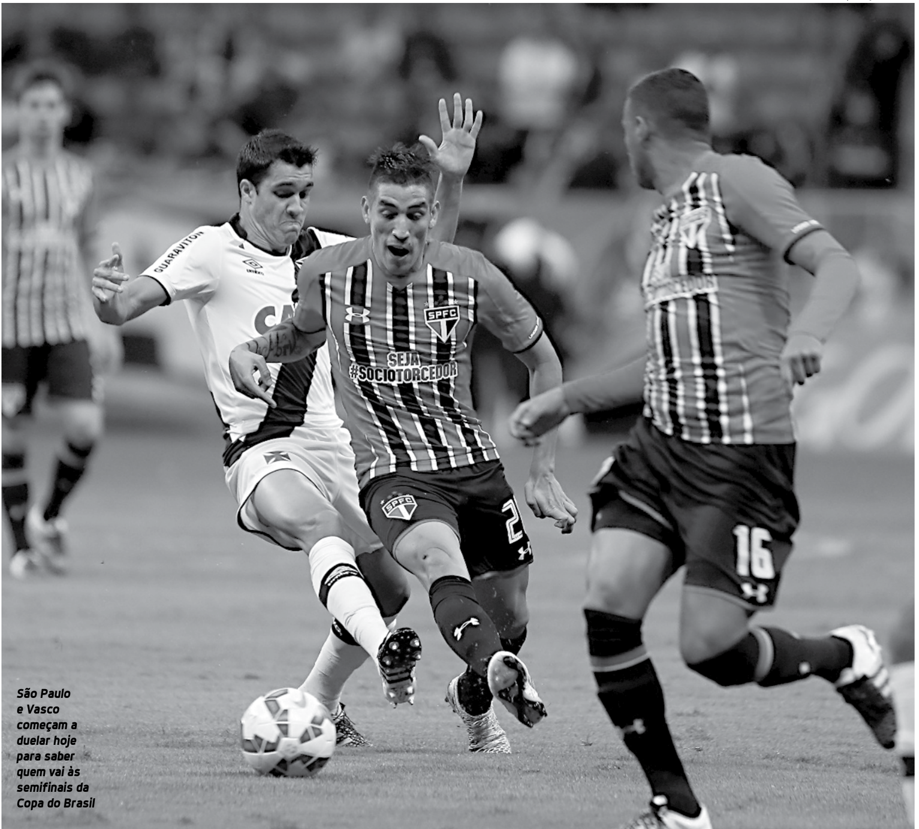
São Paulo e Vasco começam a duelar hoje para saber quem vai às semifinais da Copa do Brasil

A relação de azar entre as quartas de final e o clube do Morumbi começou logo nas três primeiras participações. Em 1990, 1993 e 1995, caiu nessa etapa diante de Criciúma, Cruzeiro e Grêmio, respectivamente. Em 1998, o algoz foi exatamente o Vasco. No primeiro jogo, empate em 1 a 1 no Morumbi e na volta, derrota por 4 a 3 em São Januário.