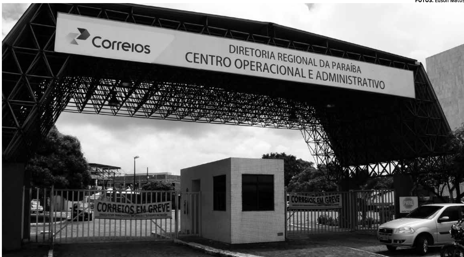
Entrada principal do Centro Operacional e Administrativo, no bairro do Cristo, está com os portões fechados, o acesso é restrito

A categoria reivindica 12% de reposição da inflação, aumento de R$ 300 no