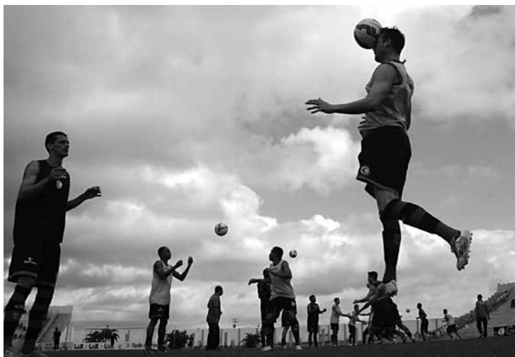
Jogadores da Raposa seguem treinando para enfrentar Operário