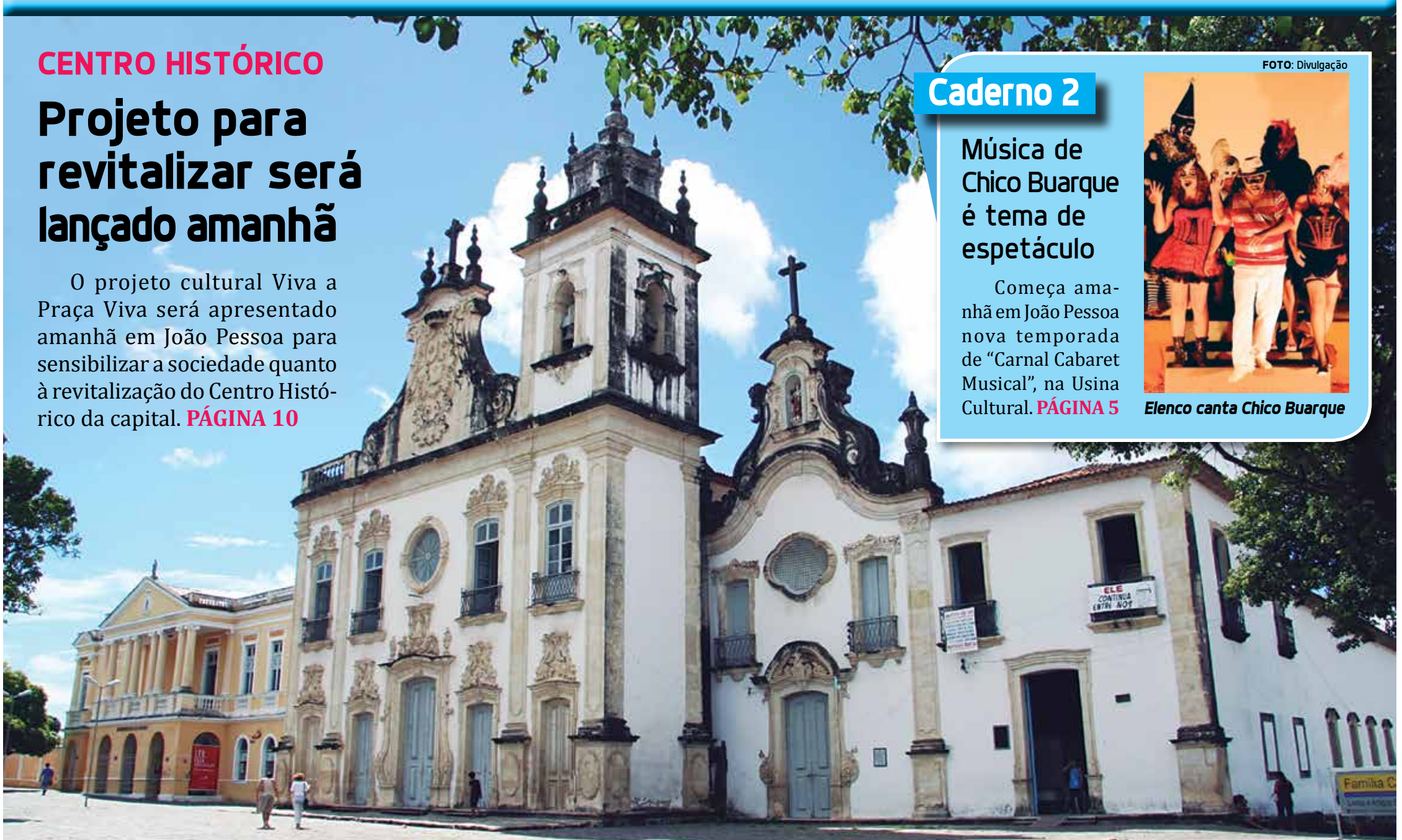
A Praça Dom Adauto será um dos espaços do Centro Histórico de João Pessoa que abrigará manifestações culturais do projeto que pretende mobilizar a sociedade para a revitalização da área

O projeto cultural Viva a Praça Viva será apresentado amanhã em João Pessoa para sensibilizar a sociedade quanto à revitalização do Centro Histórico da capital. PÁGINA 10